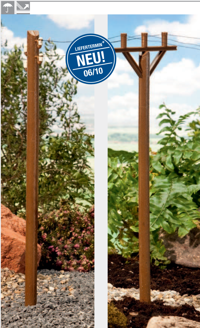
331024 Höhe: 315 mm · Height: 12.4 inch