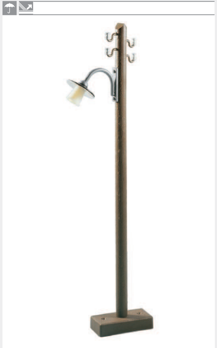
330970 Höhe: 315 mm · Height: 12.4 inch

NL Set met 6 zwakstroom- en 4 sterkstroommasten incl. draad.